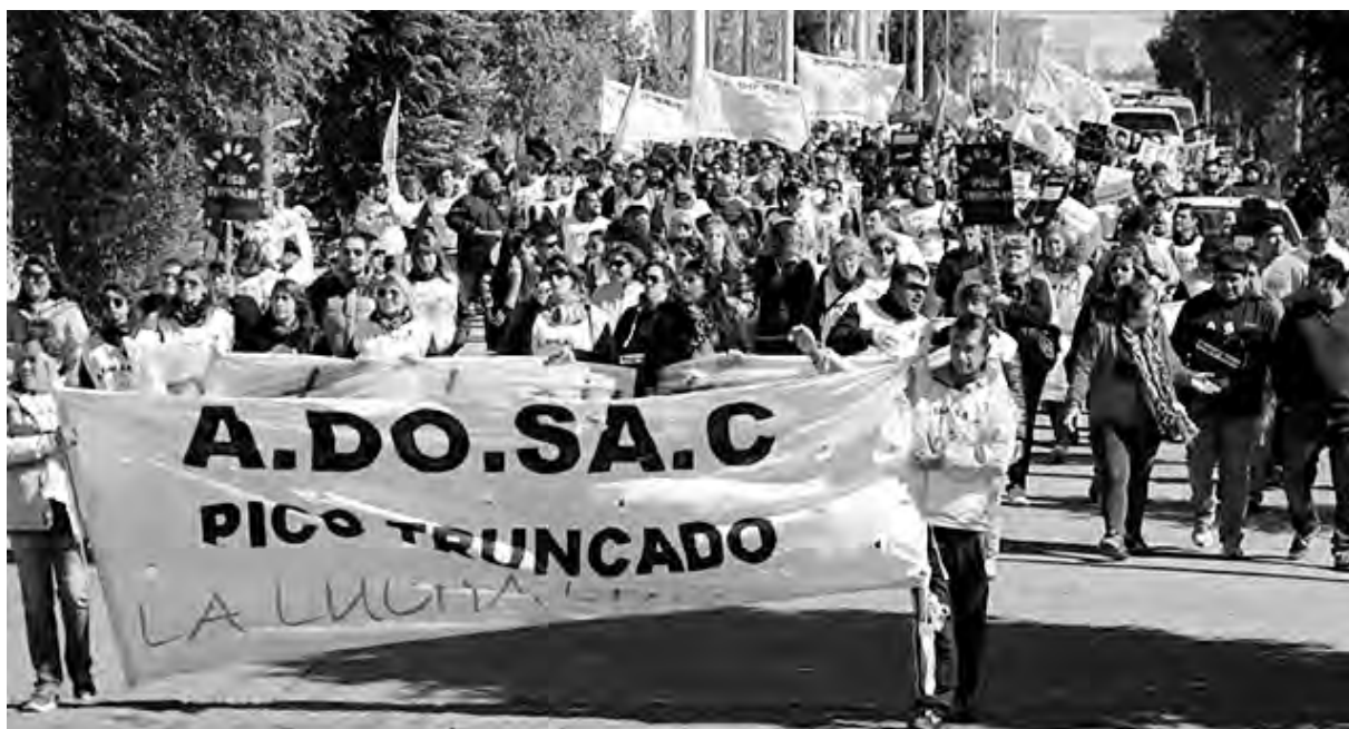
En Santa Cruz hay masivas marchas contra la miseria salarial de Alicia Kirchner

Sin embargo sus primeras medidas van en consonancia con las del gobierno nacional: despidos en el estado provincial, intentos de reformar la ley previsional y "armonizar" según las exigencias de Anses, la creación de un impuesto o sobre impuesto a los combustibles