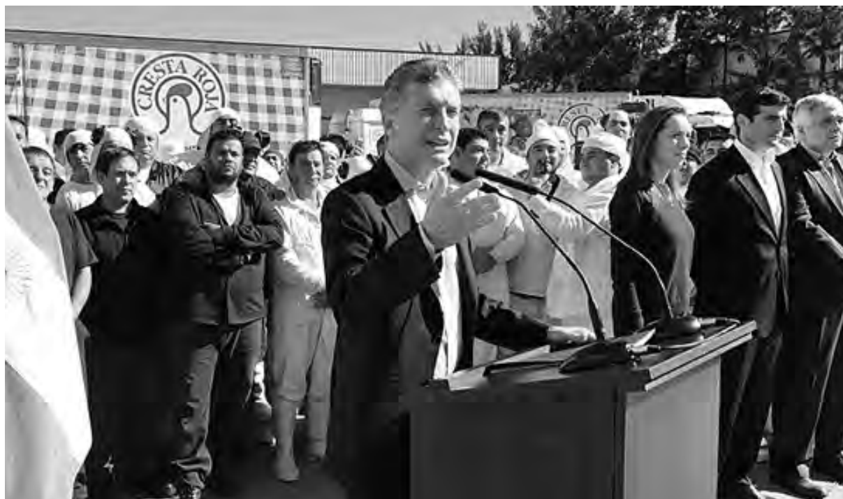
Macri en Cresta Roja oponiéndose a la prohibición de los despidos

El Ministro de Hacienda y Finanzas Alfonso Prat Gay dijo que se trata sólo de una “sensación térmica”. Su par de Trabajo, Jorge Triaca, afirma que apenas son “algunos casos puntuales”. Pero la realidad es que estamos asistiendo a una verdadera ola de despidos. Aunque el gobierno se niega a dar a conocer estadísticas todos los estudios coinciden, discrepando apenas en el tamaño de las cifras, uno más horroroso que otro. La consultora Tendencias Económicas hace ya casi dos meses “debutó” denunciando la existencia de 100.000 despidos, mitad en el sector público y mitad en el privado. En estos días, el Observatorio de Derecho Social de la CTA Autónoma denunció 73.073 despidos en el período diciembre 2015-marzo 2016: 51.151 en el sector público y 21.922 en el sector privado. El domingo 24 de abril, una infografía del Diario Tiempo Argentino (que ha vuelto a salir gestionado por sus trabajadores) señaló que existieron 45.000 despidos en el sector público, 12.000 en el estado nacional y 24.000 en provincias y municipios (aunque producto de la lucha de los propios trabajadores, se habrían dado 9.000 reincorporaciones). Y en el sector privado, el número de despidos rondaría los 84.700 (57.000 en la construcción, 12.000 en Comercio, 7.000 metalúrgicos, 3.300 en textil y calzado, 2.900 en petróleo y 2.500 en