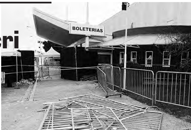
Entrada a Time Warp, en el predio de Costa Salguero

Macri y su ministra Bullrich hablan de terminar con los narcos pero le dan rienda suelta, como lo prueba