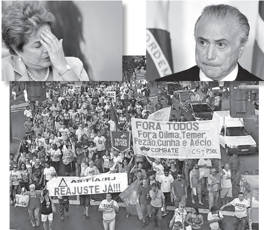
Movilización por "Fuera Todos" donde participó nuestro partido hermano de Brasil (CST)

La bancarrota del PT surge de su estrategia y de sus largos años de gobierno de conciliación con los burgueses. Hoy el PT no tiene nada que ver con un partido obrero o de iz-